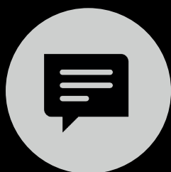
SMS et SMS enrichi