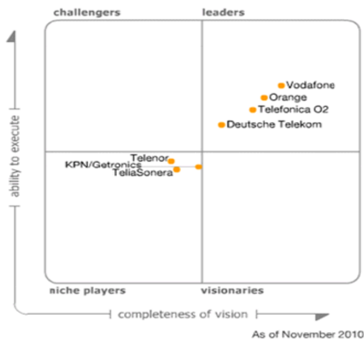
Magic Quadrant for Pan-Western European Mobile Service Providers

Orange Business Services a été également récompensé pour sa satisfaction client lors des World Record Award Telemark en 2008 ainsi qu'en 2009. Orange Business Services a été notamment classé, en 2010, parmi les leaders du « Magic Quadrant » des fournisseurs de services mobiles en Europe Occidentale. Ce rapport distingue Orange Business Services pour « sa capacité de mise en œuvre » et « l'exhaustivité de sa vision ».