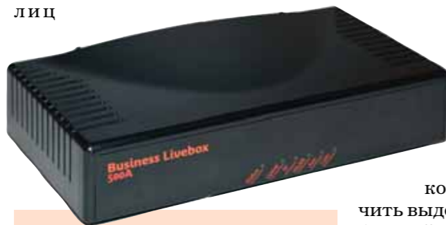
Business Livebox — инновационная разработка France Telecom

чено в небольшой коробке размером с книгу, которая работает по принципу «всё в одном», совмещая в себе модем для доступа в Интернет, точку доступа Wi-Fi и офисную мини-АТС. При разработке решения использовался весь потенциал глобальной группы France Telecom. Оно построено на базе адаптированной для российского рынка инновационной разработки — уникального интегрированного устройства доступа Business LiveBox. Устройство пользуется большой популярностью в странах Европы не только среди компаний, но и среди физических лиц